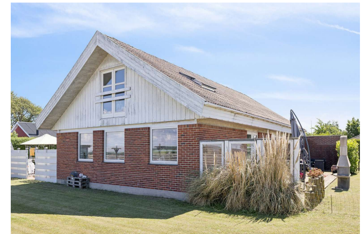
Set fra haven