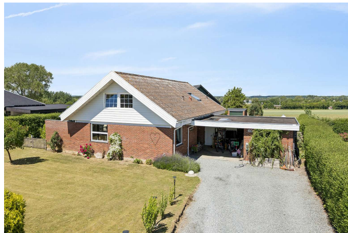
Set fra vejen