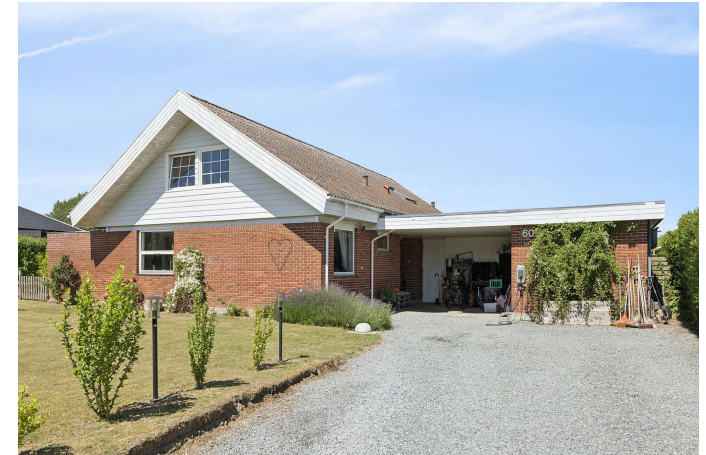
Set fra vejen