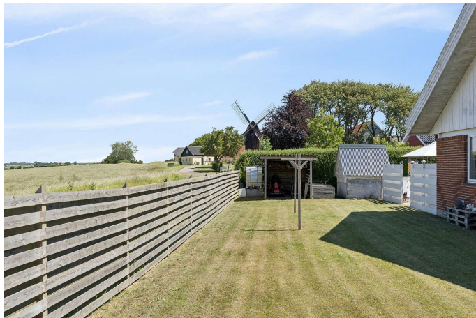
Set fra haven